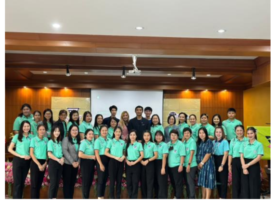
กิจกรรมพิธีเปิดโครงการพัฒนาครูและบุคลากรทางการศึกษาสู่ครูมืออาชีพ กิจกรรม การอบรมเชิงปฏิบัติการ หลักสูตรอบรม Learning with iPad