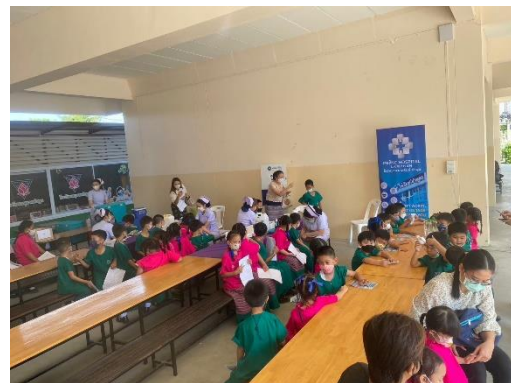
13. นักเรียนได้รับวัคซีนไขหวัดใหญ่ เพื่อเสริมสร้างภูมิคุ้มกันหมู่ ดำเนินการโดยโรงพยาบาลพริ้นซ์ ลำพูน