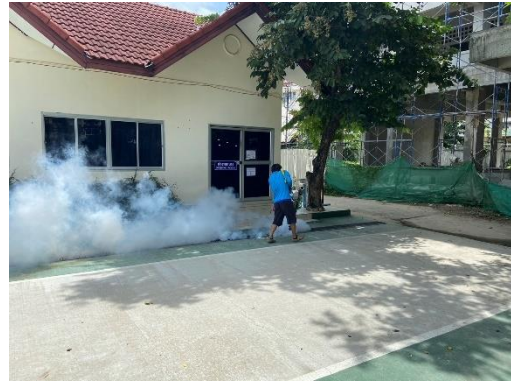
11. มีการฉีดพ่นหมอกควันไต่สูง โดยได้รับการสนับสนุนจากเทศบาลเมืองลำพูน