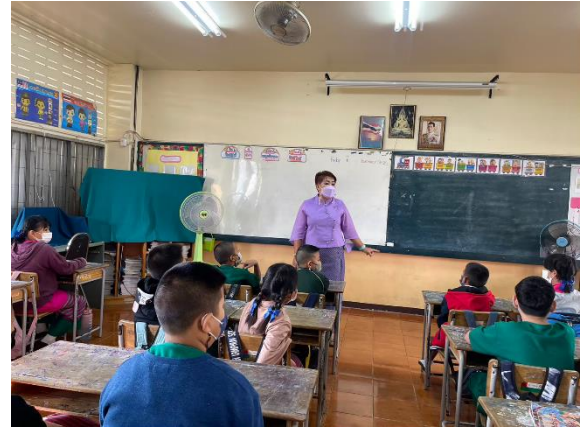
18. กิจกรรมไฮรุ่มของแต่ละชั้นเรียน