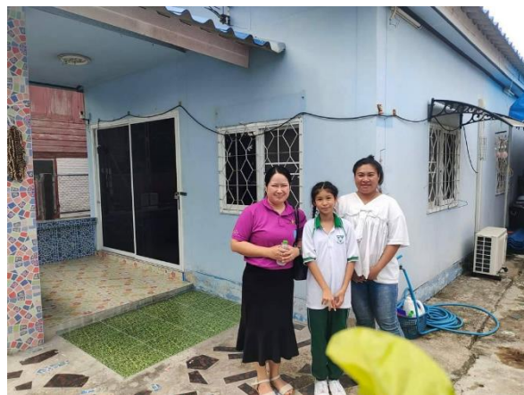
16. ครูประจำชั้นลงเยี่ยมบ้านนักเรียนของแต่ละปีการศึกษา