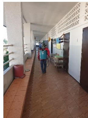
12. มีการฉีดพ่นน้ำยาฆ่าเชื้อในกรณีพบการระบาดของโรคติดต่อในห้องเรียน