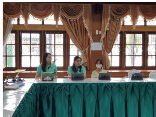
กิจกรรมการอบรม เรื่อง การใช้ Application พื้นฐาน ในการเรียนการสอน