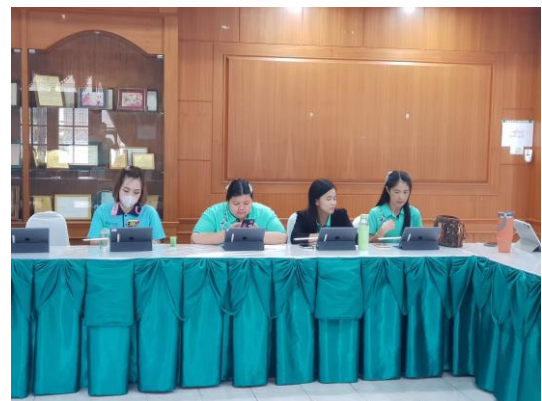
กิจกรรมการอบรม เรื่อง การใช้ iPad เบื้องต้น